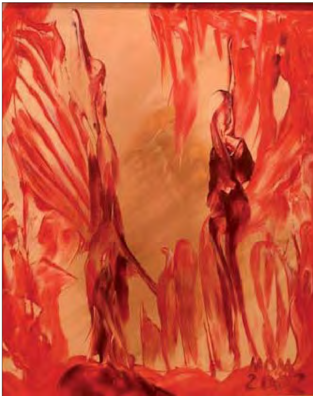
Al sur de Europa de Miguel Oscar Menassa. Óleo sobre lienzo, 61x50 cm.

Mi única familia: Una obra de arte puesta en la gran pantalla.