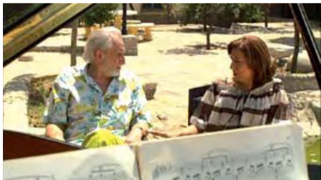
Juan y Juana conversando.