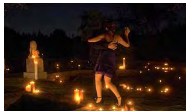
Juan y Juana bailan un tango al anochecer.