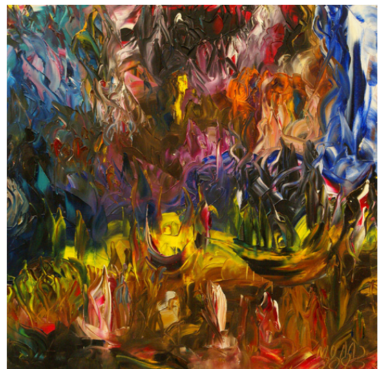
Carnaval de Venecia de Miguel Oscar Menassa. Óleo sobre lienzo de 60x60 cm.