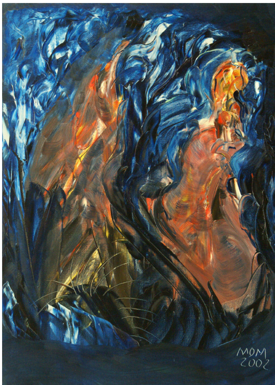
Como agua sobre piedra de Miguel Oscar Menassa. Óleo sobre lienzo de 100x73 cm.

Desde el Nº 1 (Enero 1997) al Nº 206 (Mayo 2026)