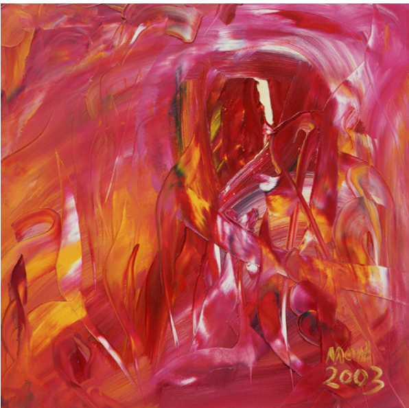
Nuestra manera de vivir de Miguel Oscar Menassa. Óleo sobre lienzo de 60x60 cm.