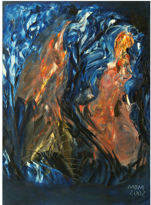
Como agua sobre la piedra de Miguel Oscar Menassa. Óleo sobre lienzo de 100x73 cm.