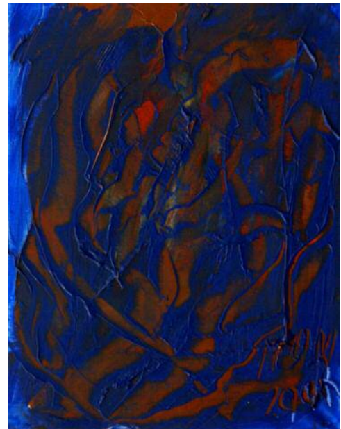
Fantasma acuático de Miguel Oscar Menassa. Óleo sobre lienzo de 35x27 cm.