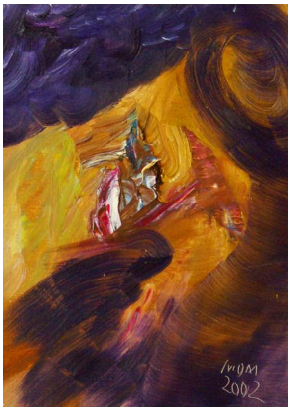
El refugio de Miguel Oscar Menassa. Óleo sobre lienzo de 46x33 cm.

La nieve empezó a caer a medianoche. Y es verdad que donde se está mejor es sentado en la cocina aunque sea la cocina del insomnio. Allí hace calor, te preparas algo, bebes vino y miras por la ventana la eternidad familiar. Por qué ibas a torturarte por saber si nacimiento y muerte son sólo puntos, puesto que la vida no es una línea recta. Por qué ibas a atormentarte al ver el calendario y a preocuparte por el valor que está en juego. ¿Y por qué ibas a admitir que no tienes ni para zapatos para Saskia? ¿Y por qué ibas a envanecerte de que sufres más que los demás? Aunque en la tierra no existiera el silencio ese nevar lo habría inventado ya en su sueño. Estás solo. Ningún gesto. Nada de qué hacer gala."