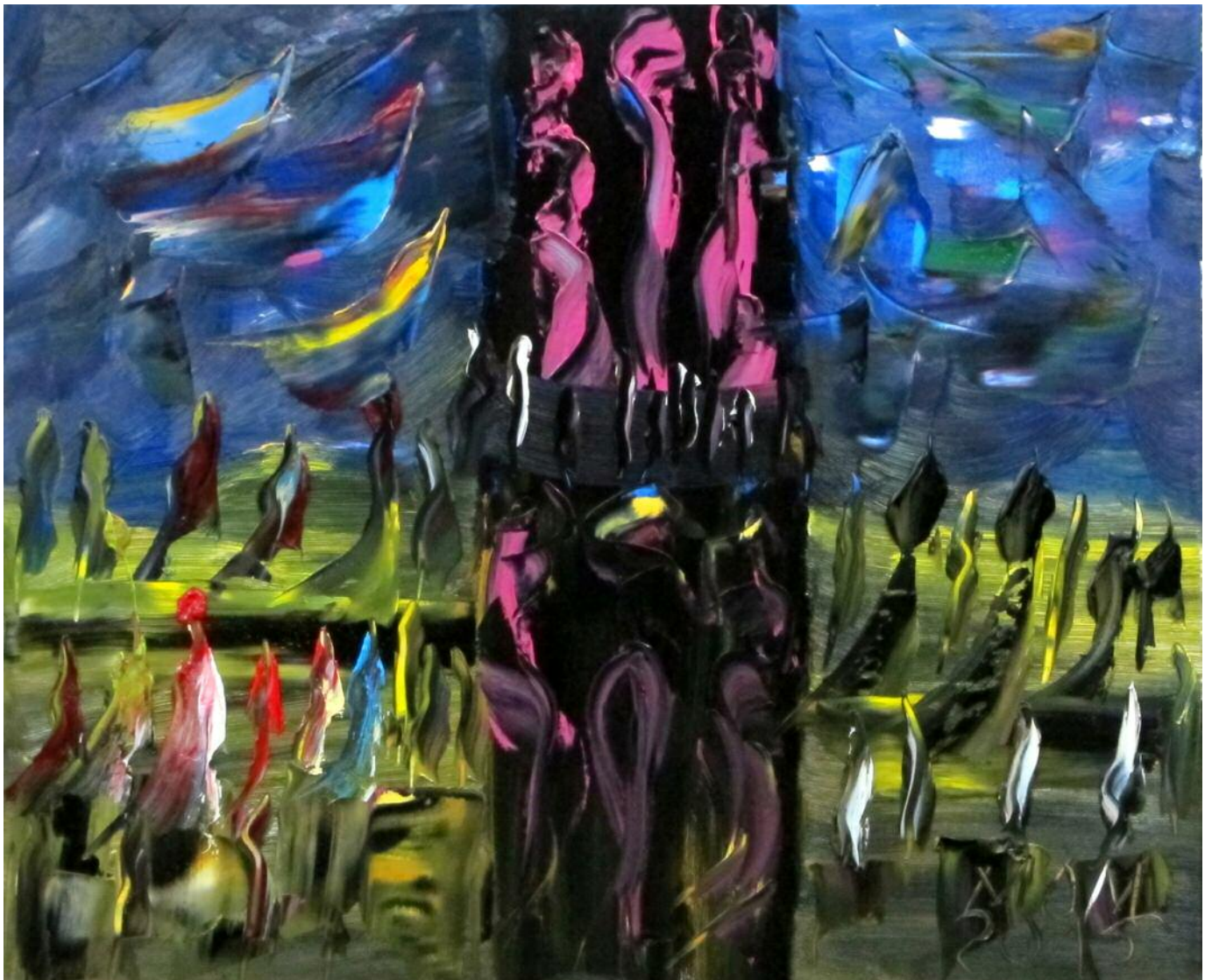
Viaje a la isla de Pascua de Miguel Oscar Menassa. Óleo sobre lienzo de 60x73 cm.

LEA ESTA REVISTA EN INTERNET www.las2001noches.com