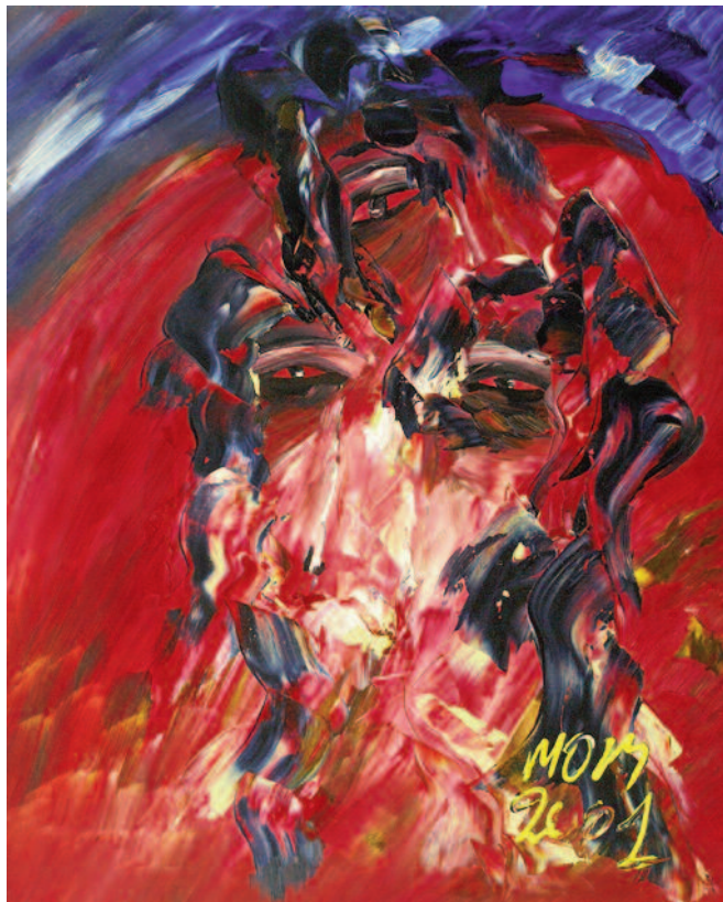
Tu mirada en mi pensamiento de Miguel Oscar Menassa. Óleo sobre lienzo de 81x65 cm.

Y aun con los ojos rígidos cerrados, con el poder de los iluminados por el mundo vital yo voy despierto.