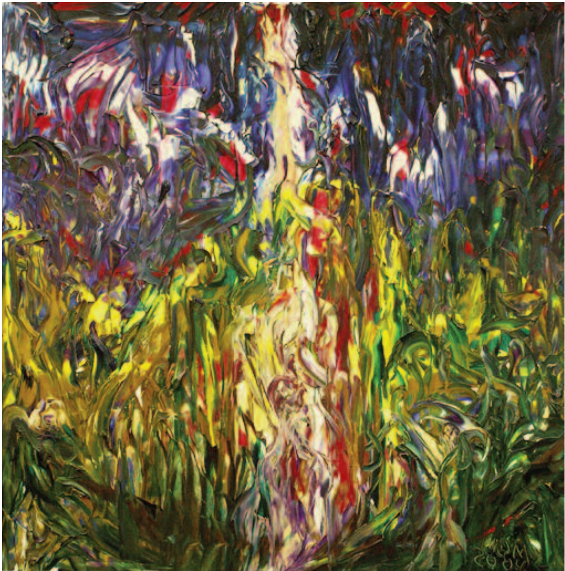
Una ley propia de la vida de Miguel Oscar Menassa. Óleo sobre lienzo de 100x100 cm.

LEA ESTA REVISTA EN INTERNET www.las2001noches.com