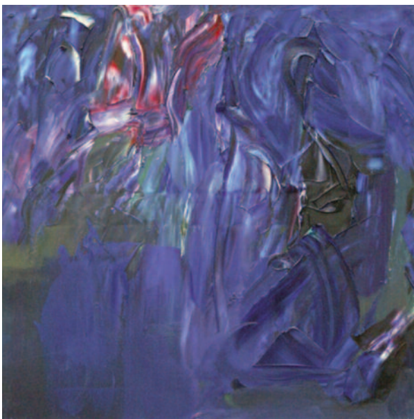
A traición de Miguel Oscar Menassa. Óleo sobre lienzo de 50x50 cm.

Si vienes tan callada como el viento en la arboleda oirás quizá lo que yo oigo verás lo que ve la tristeza. Si vienes tan ligera como el rocío entretejido te acogeré encantada y te pediré lo mismo. Puedes sentarte a mi lado como un suspiro silente y sólo los para siempre muertos se acordarán de la muerte. Si vienes, me quedaré callada y no te diré palabras agresivas; no te preguntaré porqué, ahora, ni cómo, ni lo que sabías. Sí, nos sentaremos aquí en silencio a la sombra de distintos años y la rica tierra entre nosotras se beberá nuestro llanto.