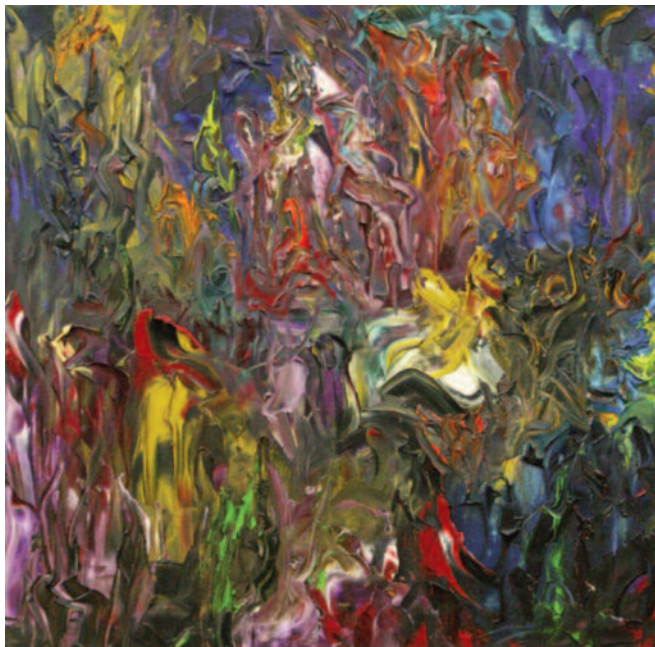
Corazón púrpura de Miguel Oscar Menassa. Óleo sobre lienzo de 50x50 cm.