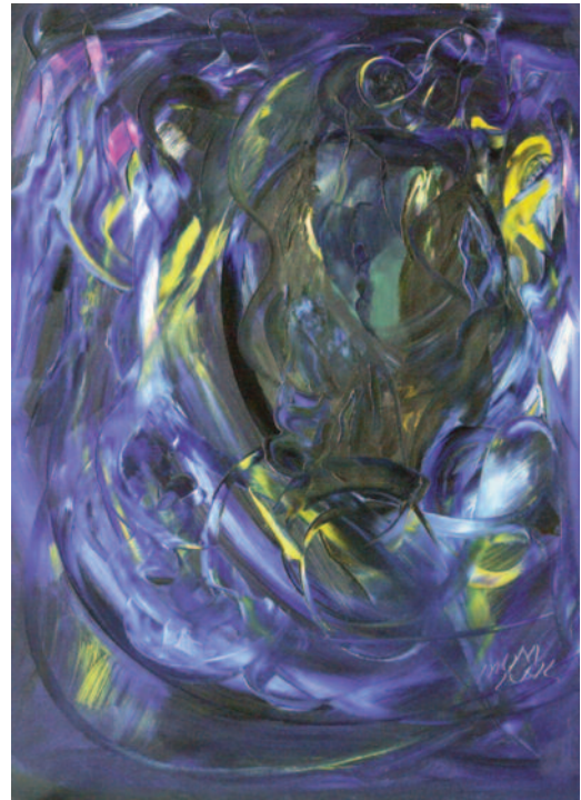
Sabiduría de Miguel Oscar Menassa. Óleo sobre lienzo de 100x73 cm.