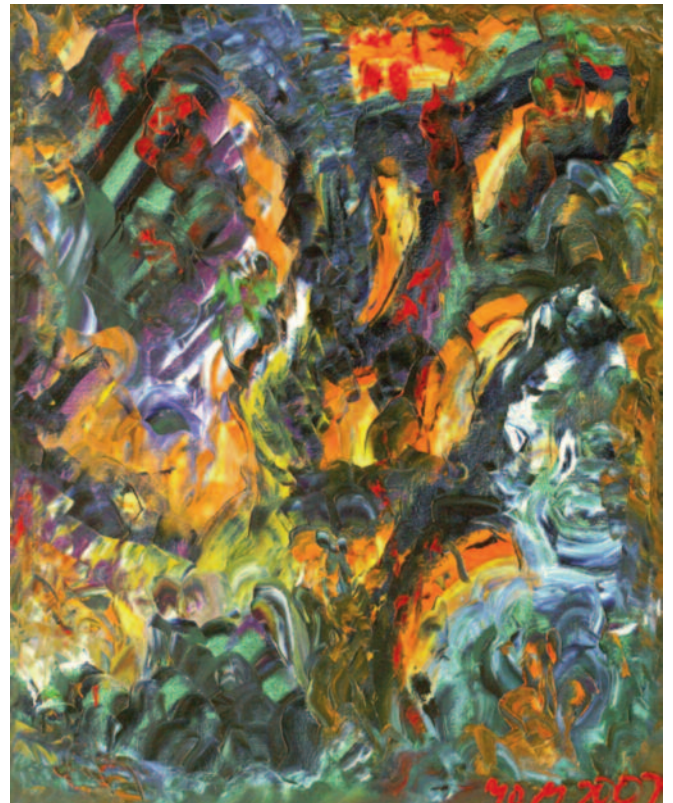
Recuerdo del Caribe I de Miguel Oscar Menassa. Óleo sobre lienzo de 100x81 cm.

Y me alejo de todo, porque todo se queda para hacer la coartada: mi zapato, su ojal, también su lodo y hasta el dobléz del codo de mi propia camisa abotonada.