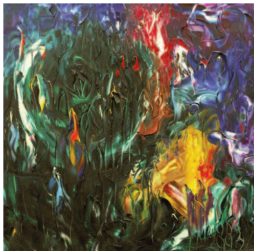
La fuente invisible , de Miguel Oscar Menassa. Óleo sobre lienzo de 60x60 cm.

actividades@grupocero.info www.grupocero.org