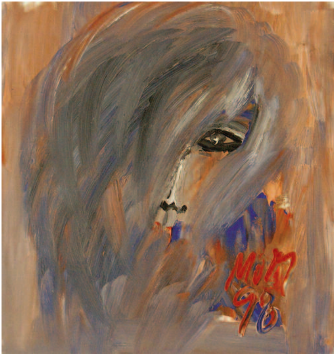
Toda la mirada , de Miguel Oscar Menassa. Óleo sobre lienzo de 50x48 cm.