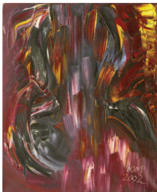
Una mirada al mundo , de Miguel Oscar Menassa. Óleo sobre lienzo de 46x38 cm.

Veinte años 1997-2017, un aniversario que muestra que nacer es permanecer.