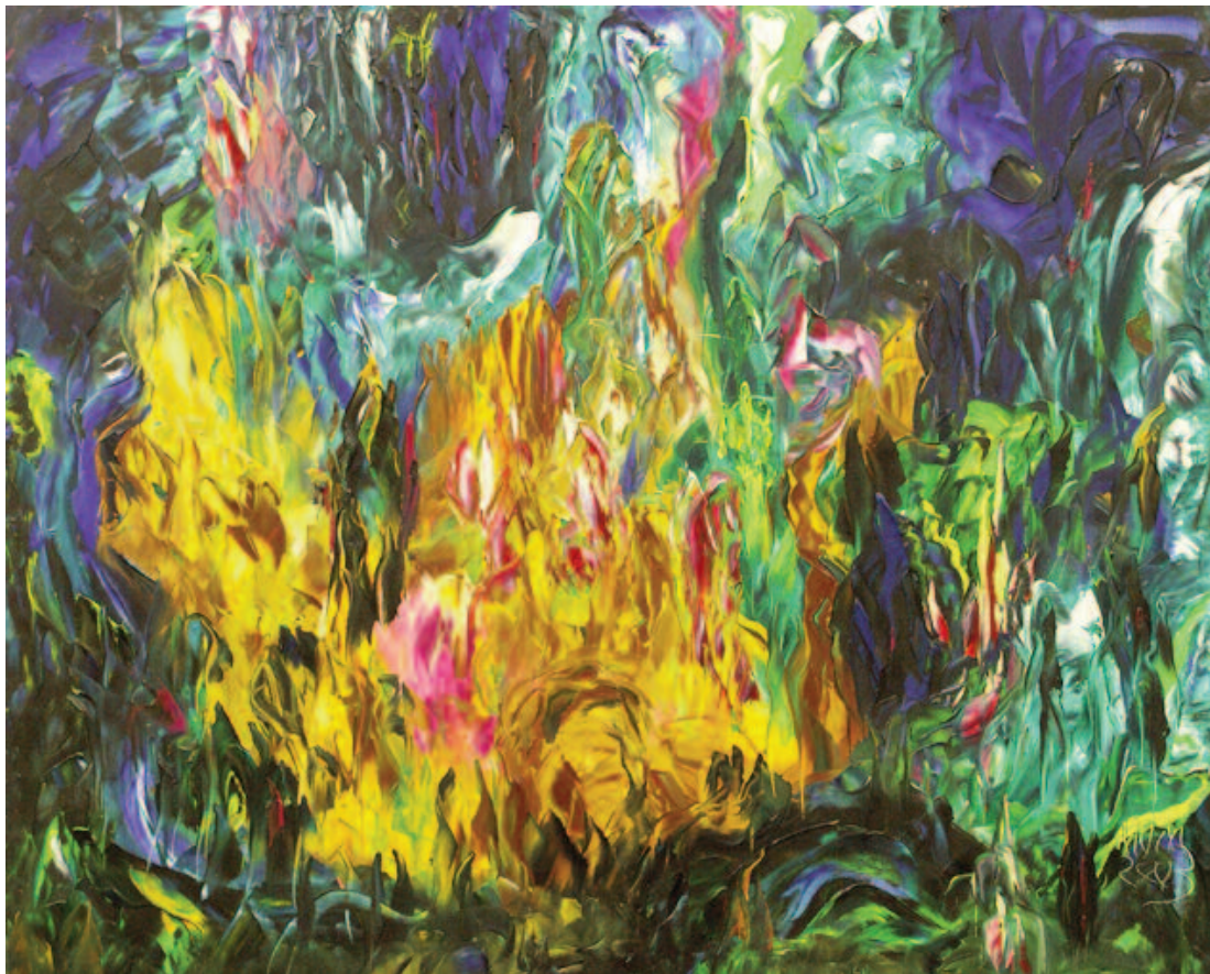
Paraíso del sur , de Miguel Oscar Menassa. Óleo sobre lienzo de 81x100 cm.