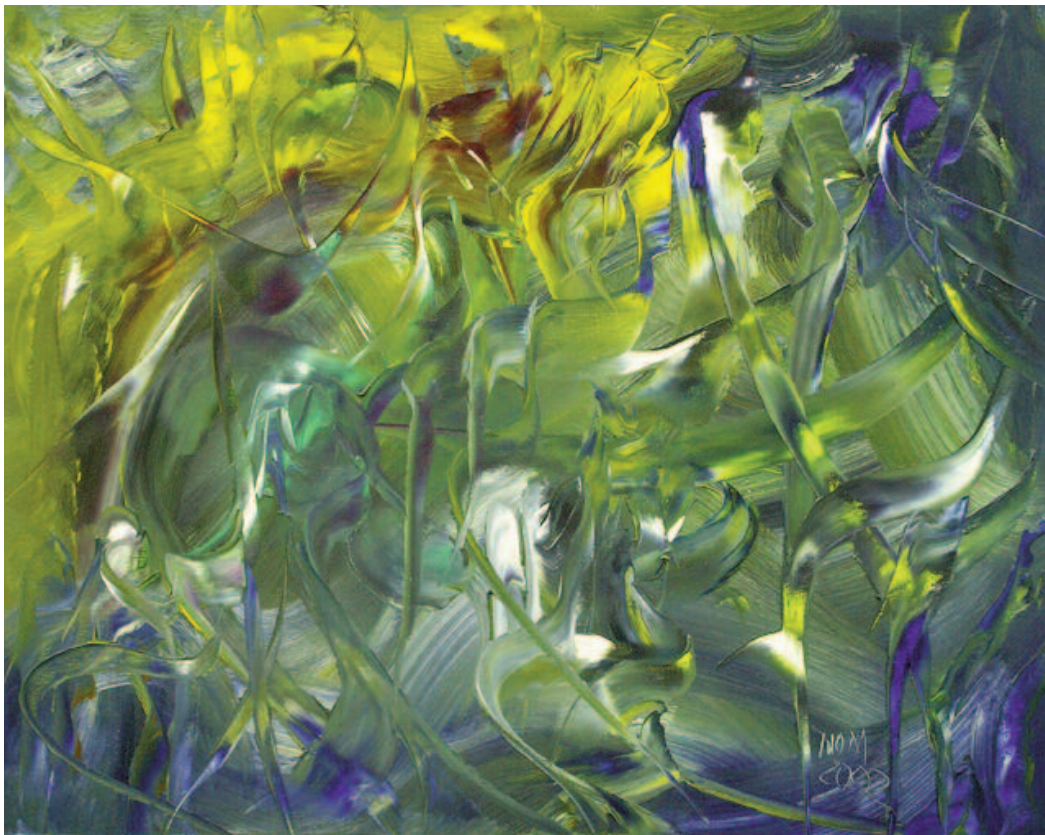
Puerta bajo el mar , de Miguel Oscar Menassa. Óleo sobre lienzo de 72x93 cm.