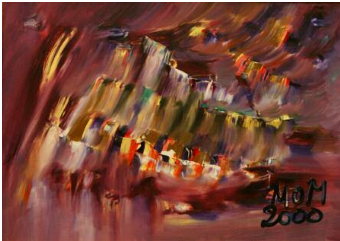
Poeta encandilado de Miguel Oscar Menassa. Óleo sobre lienzo de 50x70 cm.

Información: 91 758 19 40 - www.editorialgrupocero.com - pedidos@editorialgrupocero.com