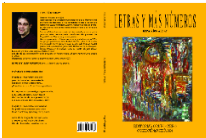
LETRAS Y MÁS NÚMEROS Kepa Ríos Alday