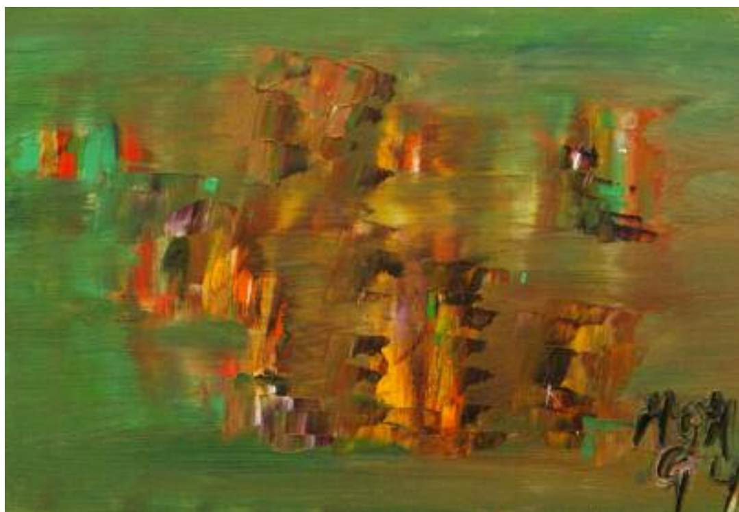
Ciudad perdida de Miguel Oscar Menassa. Óleo sobre lienzo, 24x35 cm.

Hoy va tomando difusión la teoría contraria, naturalmente justa, de que el intelectual, y especialmente el narrador, debe romper el aislamiento, tomar parte en la vida activa, tratar la realidad. Pero esto es, precisamente, una teoría. Es un deber que se nos impone "por necesidad histórica". Y nadie ama por teoría o