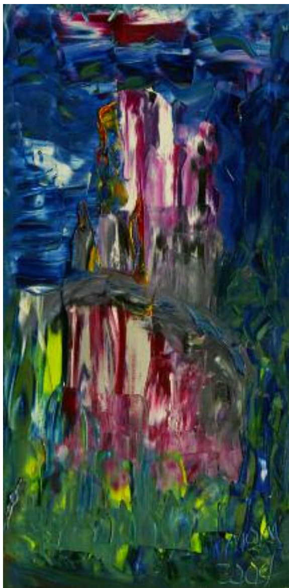
Renacimiento de Miguel Oscar Menassa. Óleo sobre lienzo de 80x40 cm.