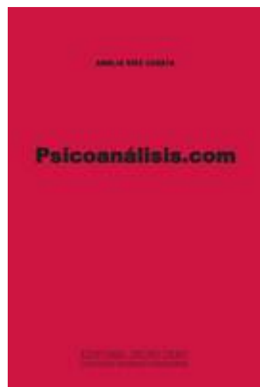
PSICOANÁLISIS.COM Amelia Díez Cuesta