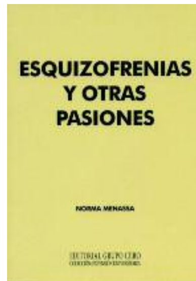
ESQUIZOFRENIAS Y OTRAS PASIONES Norma Menassa