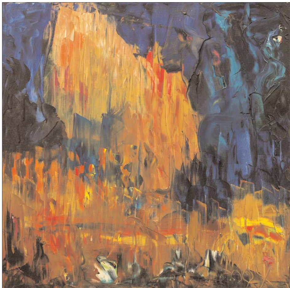
Todo lo necesario de Miguel Oscar Menassa. Óleo sobre lienzo, 60x60 cm

Y aquí estoy yo otra vez; aquí sola. Sola, sí. Sola y en cruz. España-Cristo -con la lanza cainita clavada en el costado, sola y desnuda -jugándose mi túnica dos soldados vesánicos-. Sola y desamparada -miradme cómo se lava las manos el Pretor-. Y sola, sí, sola, sola sobre este yerbo seco que ahora riega mi sangre; sola sobre esta tierra española y planetaria; sola sobre mi estepa y bajo mi agonía; sola sobre mi calvero y bajo mi calvario; sola sobre mi Historia de viento, de arena y de locura, y bajo los dioses y los astros levanto hasta los cielos esta oferta: Estrellas: vosotras sois la luz. La Tierra, una cueva tenebrosa sin linterna y yo tan sólo sangre, sangre, sangre, sangre... España no tiene otra moneda... ¡Toda la sangre de España por una gota de luz!