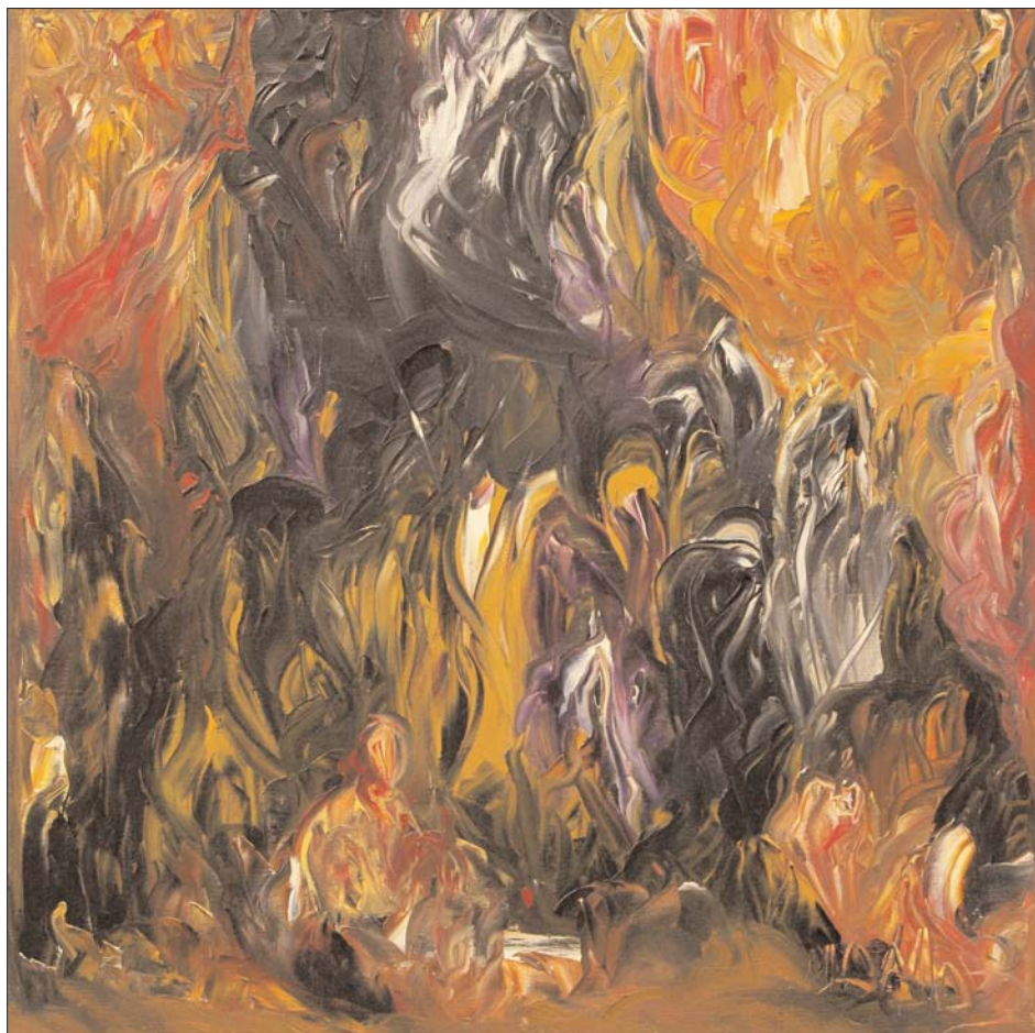
Nuevas formas del despertar de Miguel Oscar Menassa. Óleo sobre lienzo, 60x60 cm

www.grupocerobuenosaires.com baire@grupocero.org