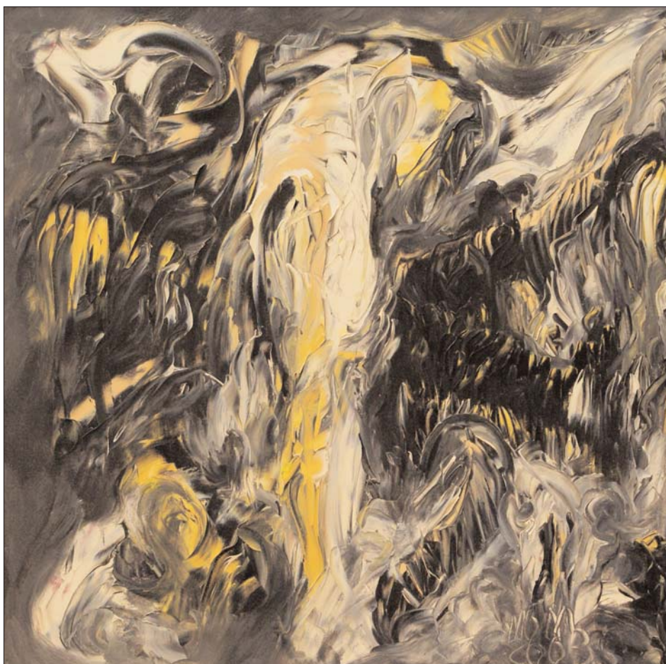
Después de la fiesta de Miguel Oscar Menassa. Óleo sobre lienzo, 60x60 cm

Yace la cuerda así al pie del violín, cuando hablaron del aire, a voces, cuando hablaron muy despacio del relámpago. Se dobla así la mala causa, vamos de tres en tres a la unidad; así se juega a copas y salen a mi encuentro los que aléjanse, acaban los destinos en bacterias y se debe todo a todos.