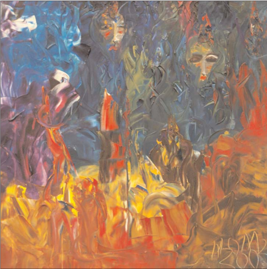
Preparando la batalla de Miguel Oscar Menassa. Óleo sobre lienzo, 60x60 cm

Cabalgando feroz en su locura yo soy ese pequeño sol de la mañana.