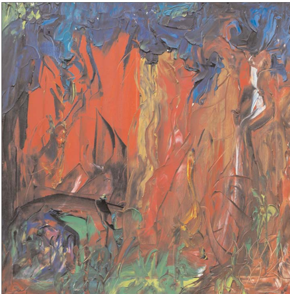
Más allá de las colinas de Miguel Oscar Menassa. Óleo sobre lienzo, 60x60 cm