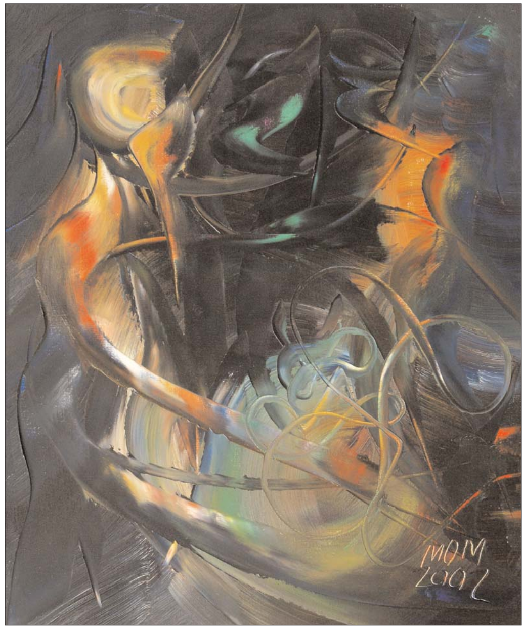
El alquimista de Miguel Oscar Menassa. Óleo sobre lienzo, 60x50 cm.