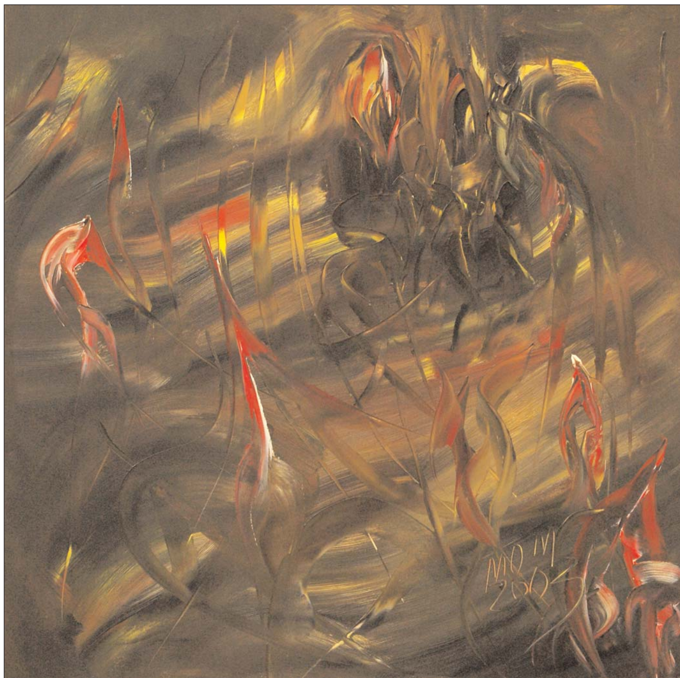
El sol a media noche de Miguel Oscar Menassa. Óleo sobre lienzo, 80x80 cm.

No, tampoco tú, aunque niegues tu empeño entre fulgores y lo sepultes [entre escombros; aunque traces tus límites acatando el cuchillo de la pequeña [ley; por más que te deshojes para demostrar que la rosa de Rilke no encierra ningún sueño bajo tantos [párpados.