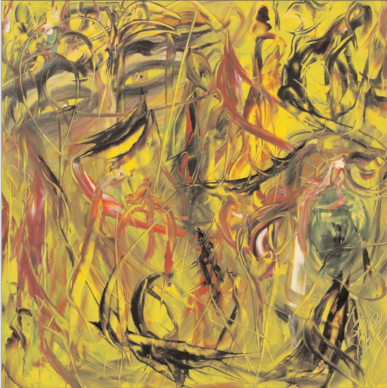
Ágiles bailarinas de Miguel Oscar Menassa. Óleo sobre lienzo, 80x80 cm