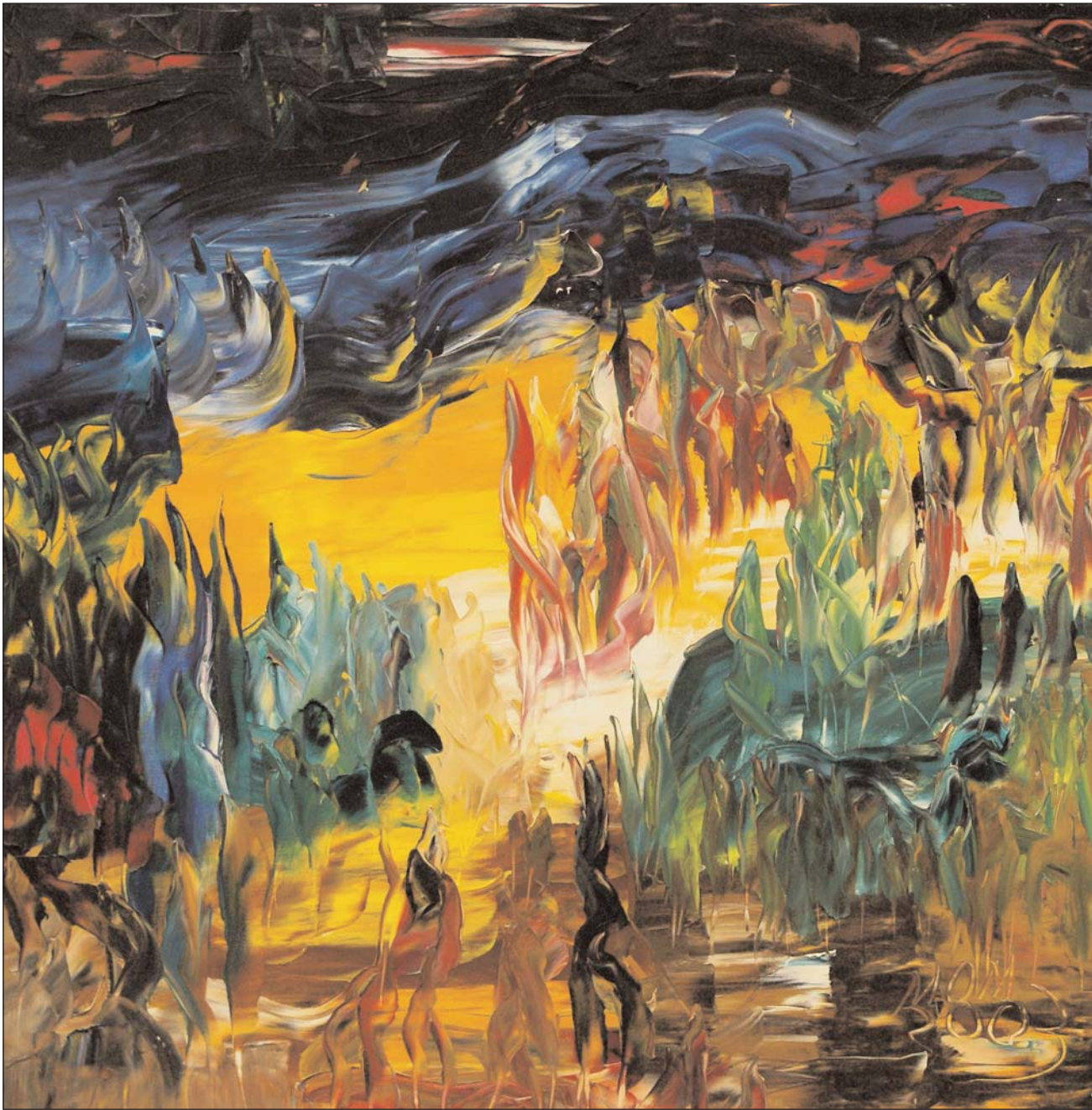
El baile de los dioses de Miguel Oscar Menassa. Óleo sobre lienzo, 80x80 cm.

“El noventa por ciento de los políticos, da mala reputación al otro diez por ciento.”