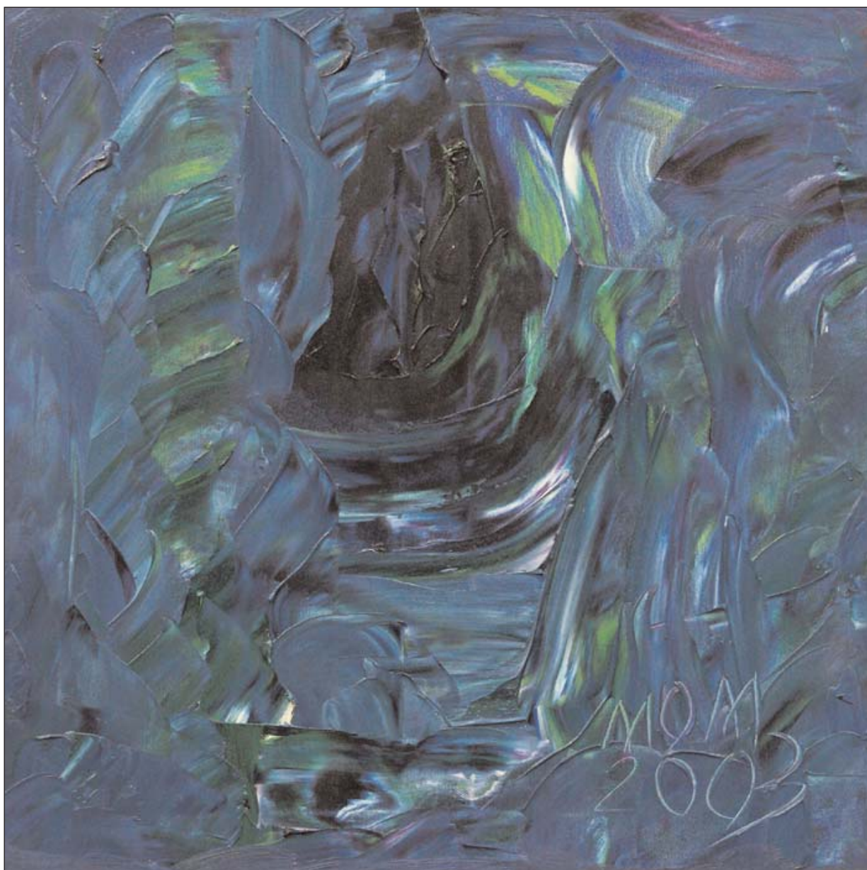
Ensoñación de Miguel Oscar Menassa. Óleo sobre lienzo, 50x50 cm.

www.grupocerobuenosaires.com bares@grupocero.org