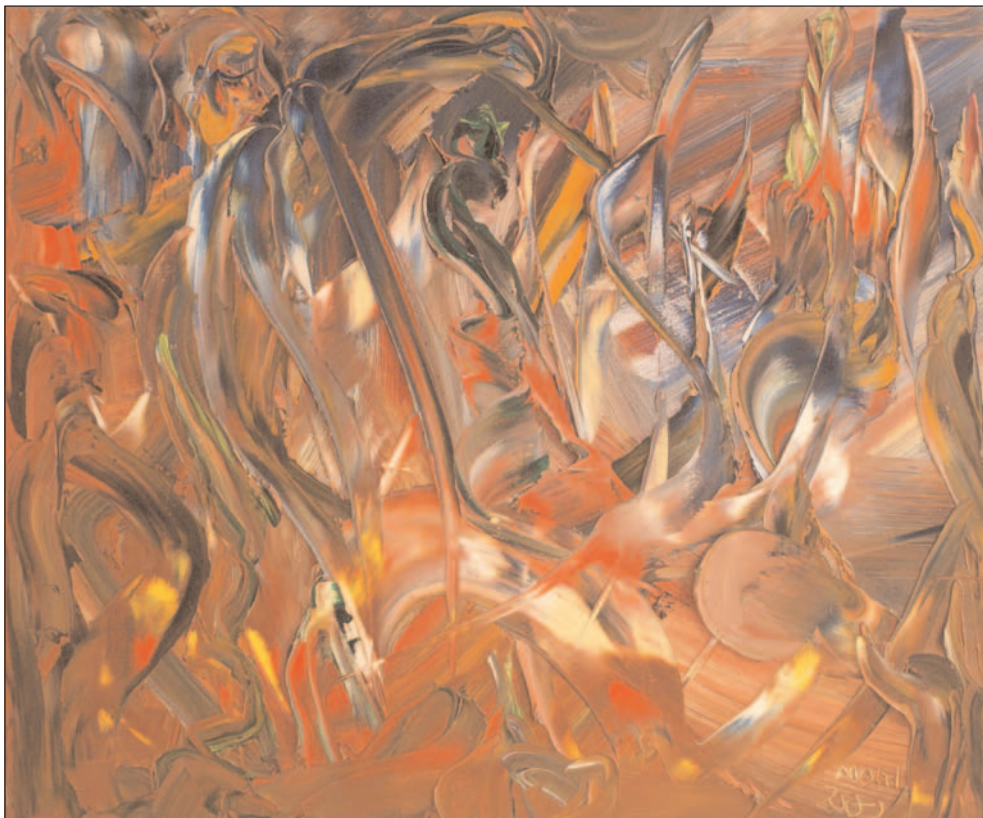
Navegando entre titanes de Miguel Oscar Menassa. Óleo sobre lienzo, 50x60 cm.

635_ La poesía también es económica, sin necesidad de ser loca o burguesa.