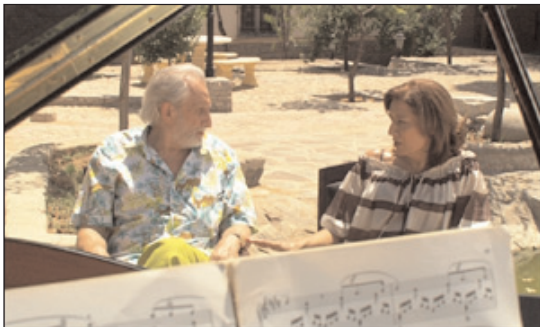
Juan y Juana conversando.