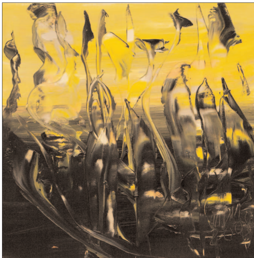
Los siglos venideros de Miguel Oscar Menassa. Óleo sobre lienzo, 40x40 cm.