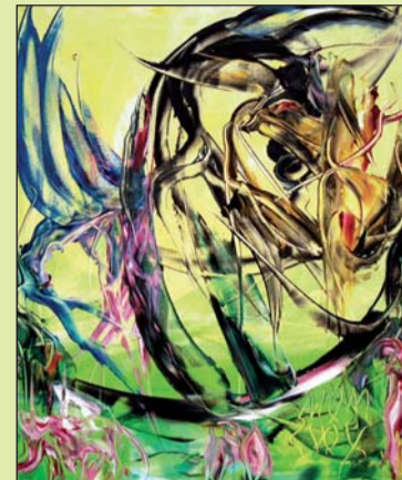
Fragilidad del viento. Óleo sobre lienzo 61x50.