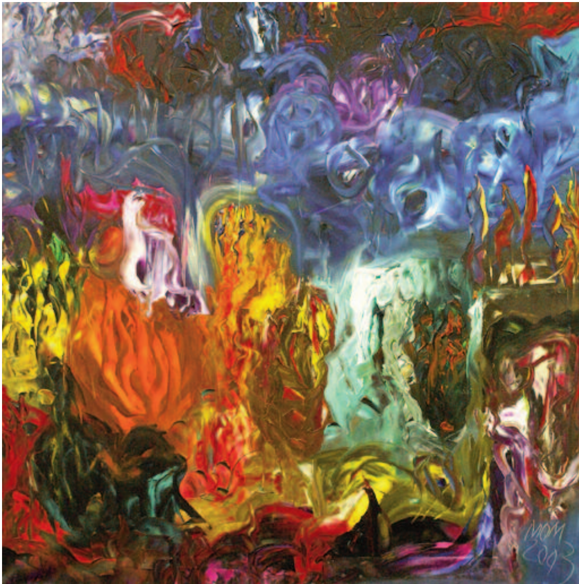
Esmeralda y coral en tu mirada de Miguel Oscar Menassa. Óleo sobre lienzo de 100x100 cm.

LEA ESTA REVISTA EN INTERNET www.las2001noches.com