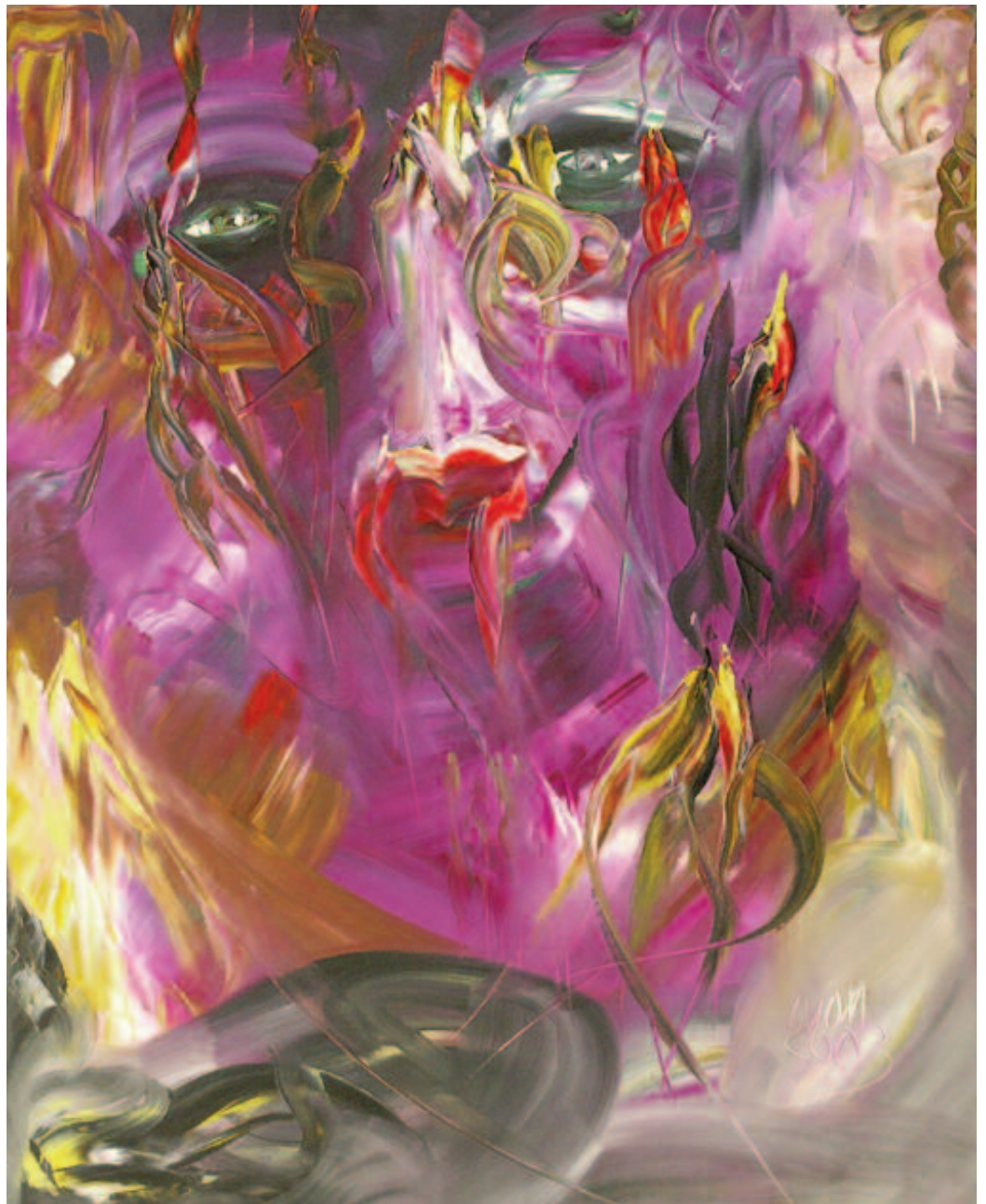
Blanca extranjera mía , de Miguel Oscar Menassa. Óleo sobre lienzo de 100x81 cm.

NADIE, NUNCA, ME ALCANZARÁ, SOY LA POESÍA