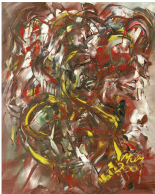
Sin control de Miguel Oscar Menassa. Óleo sobre lienzo de 100x81 cm.