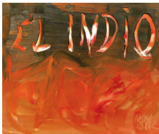
El indio de Miguel Oscar Menassa. Óleo sobre lienzo de 50x60 cm.