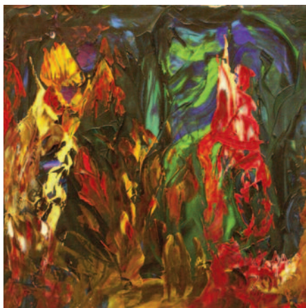
Y nosotros mantenemos de Miguel Oscar Menassa. Óleo sobre lienzo de 50x50 cm.

No tengo otra palabra que mi boca para hablar de mí mismo, mi lengua tartamuda que nombra la mitad de mis visiones bajo la lucidez de mi propia tortura, como el ciego que llora contra un sol implacable.