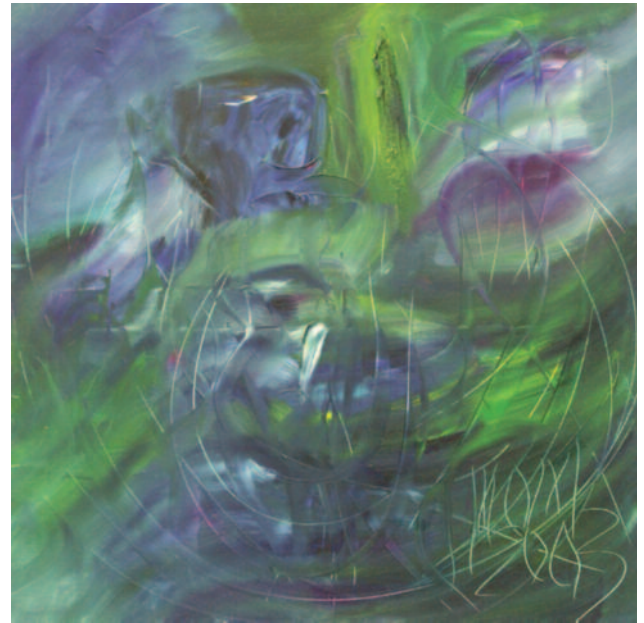
El verdadero olor , de Miguel Oscar Menassa. Óleo sobre lienzo de 60x60 cm.