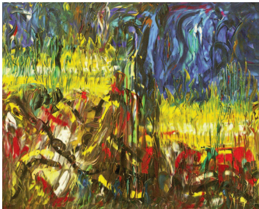
Guerra entre hermanos , de Miguel Oscar Menassa. Óleo sobre lienzo de 81x100 cm.