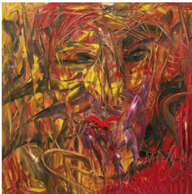
Rotas ilusiones , de Miguel Oscar Menassa. Óleo sobre lienzo de 60x60 cm.