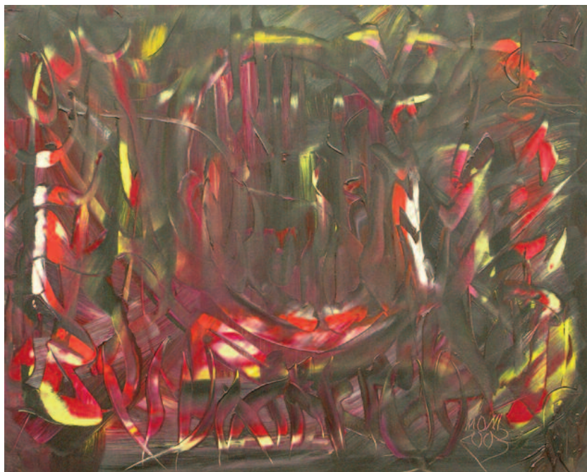
La sal de la vida , de Miguel Oscar Menassa. Óleo sobre lienzo de 81X100 cm.

Una dócil fibra Del universo. Mi suplicio Es cuando No me creo en armonía Pero esas ocultas Manos Que me deslíen Me regalan La rara Felicidad He repasado Las épocas De mi vida Estos son Mis ríos Este es el Serchio En el que han bebido Dos mil años tal vez De mi gente campesina Y mi padre y mi madre. Este es el Nilo Que me ha visto Nacer y crecer Y arder de inconsciencia En las extensas llanuras Este es el Sena Y en su turbulencia Me he mezclado Y me he conocido Estos son mis ríos Reunidos en el Isonzo Esta es mi nostalgia Que en cada uno Me trasparente Ahora que es noche Que mi vida me parece Una corola De tinieblas