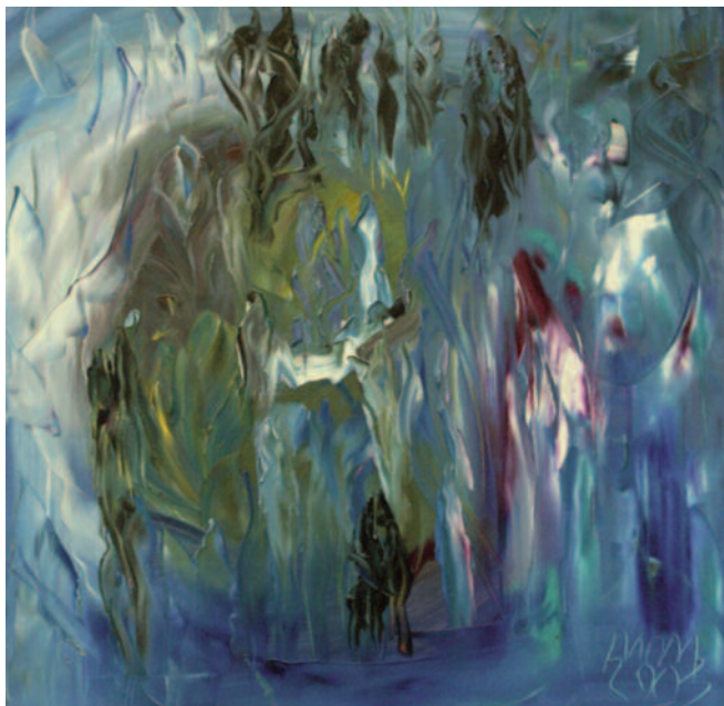
Cielos para la soledad , de Miguel Oscar Menassa. Óleo sobre lienzo de 60x60 cm.

¡Oh mi Stanton, idiota y bello entre los pequeños animalitos,