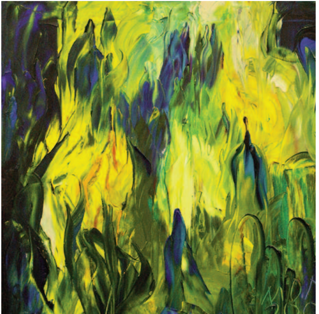
Fantasmas diurnos , de Miguel Oscar Menassa. Óleo sobre lienzo de 60x60 cm.