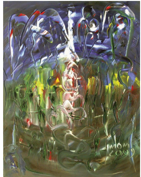
Los minutos felices de Miguel Oscar Menassa. Óleo sobre lienzo de 92x73cm.

Vejez es cuando a un hombre arrimado al fuego de la chimenea temblando a causa de las brujas para poner el cazo sobre el lecho y traerle su ponche viene ella en las cenizas quien amada no pudo ser vencida o vencida no amada o alguna otra aflicción viene con las cenizas como en esa luz vieja el rostro en las cenizas aquella vieja luz de las estrellas en la tierra otra vez.