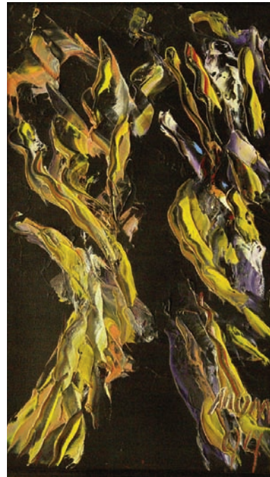
Antes del amor de Miguel Oscar Menassa. Óleo sobre lienzo de 41x24cm.

Escribo unas palabras y al minuto ya dicen otra cosa, significan una intención distinta, son ya dóciles al Carbono 14: Criptogramas de un pueblo remotísimo que busca la escritura en tinieblas.