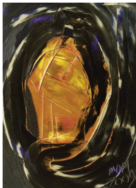
Un nuevo sol de Miguel Oscar Menassa. Óleo sobre lienzo de 55x38 cm.

La química había alcanzado el cerebro de los poderosos y cualquier hijo de puta se podía suicidar bebiendo una gaseosa en mal estado.