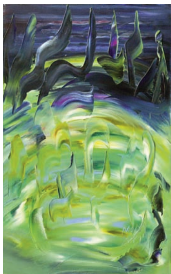
Un poema suelto de Miguel Oscar Menassa. Óleo sobre lienzo de 61x38 cm.