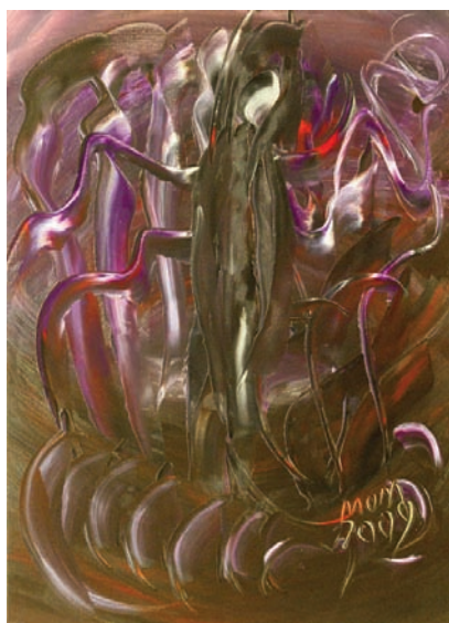
La viuda negra de Miguel Oscar Menassa. Óleo sobre lienzo de 81x60 cm.