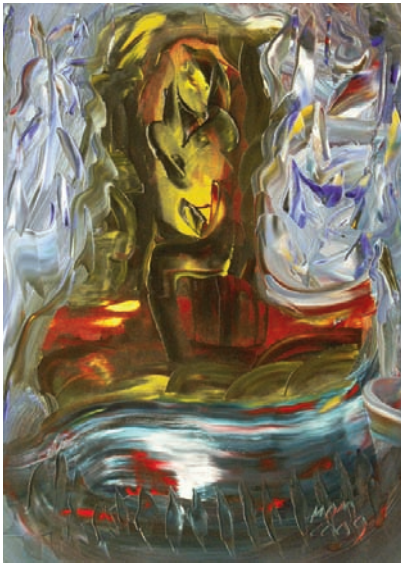
Antorcha viviente de Miguel Oscar Menassa. Óleo sobre lienzo de 81x60 cm.

queréis que vaya de A a B yo no puedo no puedo salir estoy en un país sin huellas sí sí es algo hermoso lo que tenéis ahí es algo hermoso qué es no me hagáis más preguntas espiral polvo de instantes qué es lo mismo la calma el amor el odio la calma la calma