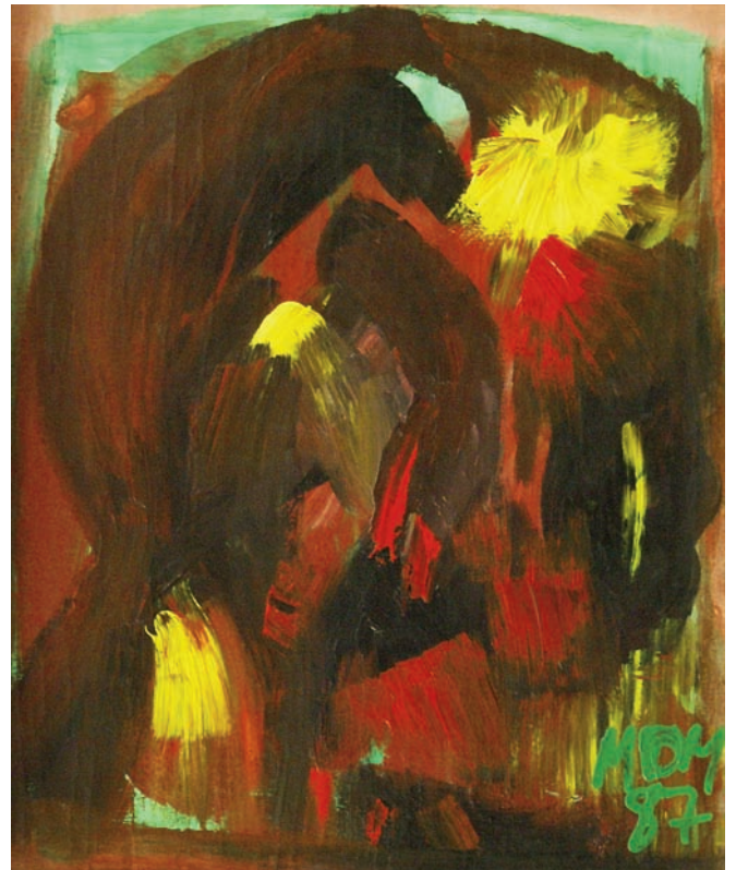
Retrospectiva de Miguel Oscar Menassa. Óleo sobre lienzo de 57x47cm.

Pero detrás de mí no queda nadie para seguir hilando la trama de mi raza. Estas piedras lo saben, cerradas como puños obstinados. Estas piedras aluden nada más que a unos huesos cada vez más blancos. Anuncian solamente el final de una crónica, apenas una lápida.