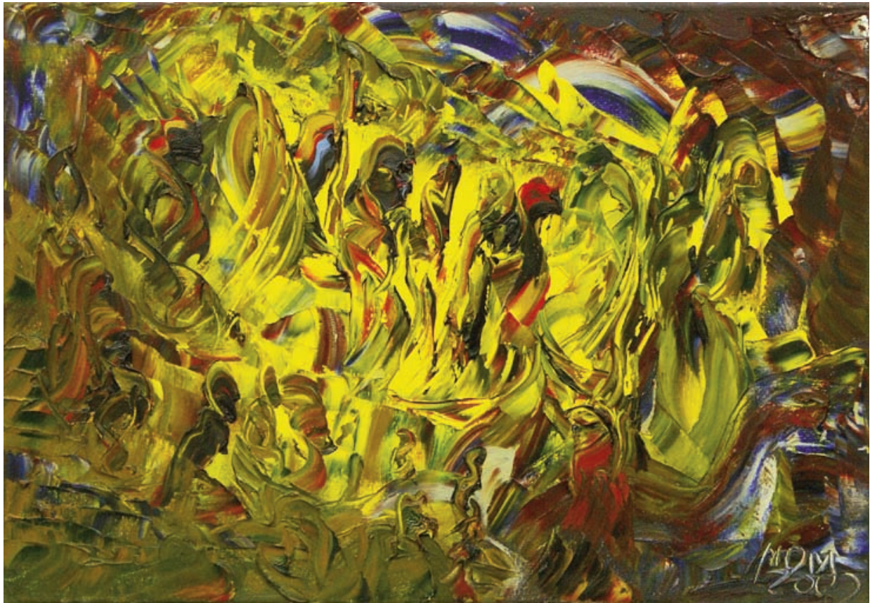
Poblado indígena el día de la fiesta de Miguel Oscar Menassa. Óleo sobre lienzo de 38x55 cm.

El virus de la corrupción había alcanzado todo Estado. Hasta Rusia y China conmovieron al mundo con sus propias contradicciones económicas ¡increíble!