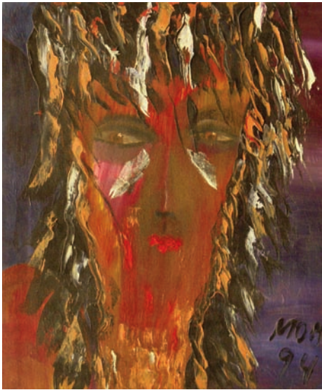
Bella de día de Miguel Oscar Menassa. Óleo sobre lienzo de 54x46cm.