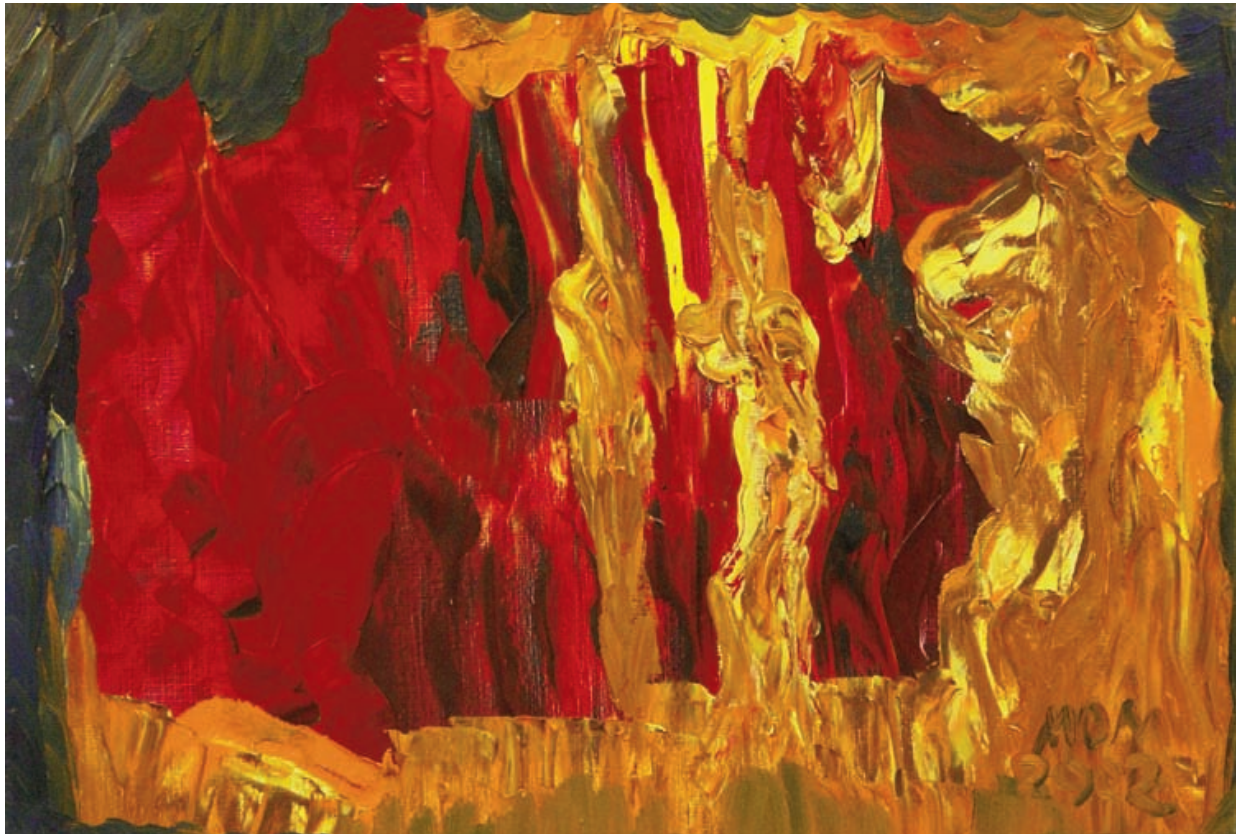
Bailando en la caverna de Miguel Oscar Menassa. Óleo sobre lienzo de 38x55 cm.