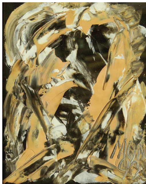
Danza de la fortuna de Miguel Oscar Menassa. Óleo sobre lienzo de 40x32 cm.

En lo alto del día eres el que regresa a borrar de la arena la oquedad de su paso; el héroe imperdonable que escapó del combate y apoyado en su escudo mira arder la derrota; el naufrago sin nombre que se aferra a otro cuerpo para que el mar no arroje su cadáver a solas; el perpetuo exiliado que en el desierto mira arder hondas ciudades cuando el sol retrocede; el que clavó sus armas en la piel de un dios muerto y ahora escucha en el alba cantar un gallo y otro porque las profecías van a cumplirse, atónito y sin embargo cierto de haber negado todo; el que abre la mano y recibe la noche.