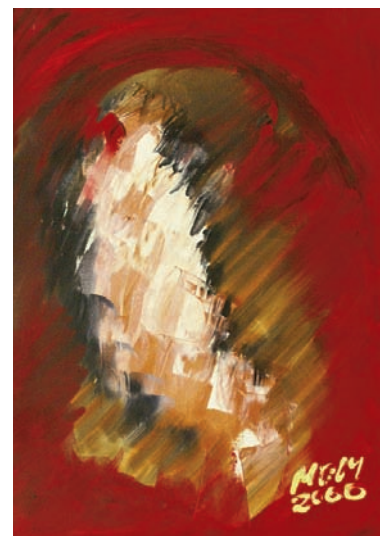
La cápsula del tiempo de Miguel Oscar Menassa. Óleo sobre lienzo de 73x50cm.