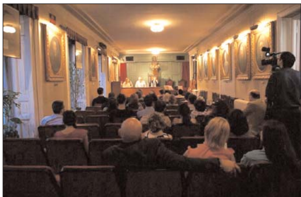
Público asistente al acto.

Sin solución de continuidad, tres danzas de la Suite I de Bach acompañaban algunos versos más en el segundo tiempo: la marea baja del Preludio mecía los arpeggios deshojados de