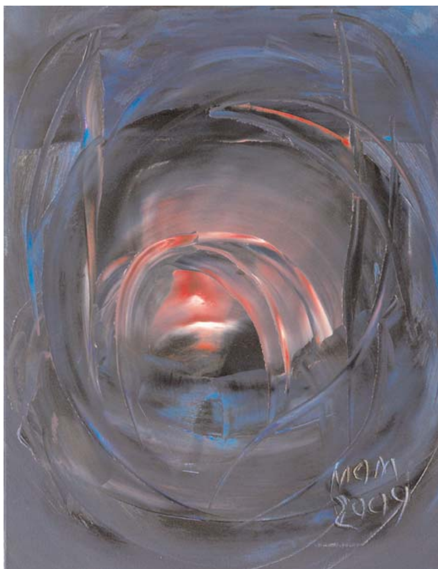
Tercer embarazo de Miguel Oscar Menassa. Óleo sobre lienzo, 65x50 cm.