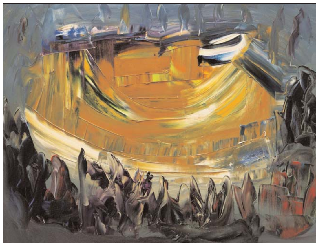
Fiesta entre amigos de Miguel Oscar Menassa. Óleo sobre lienzo, 50x65 cm.