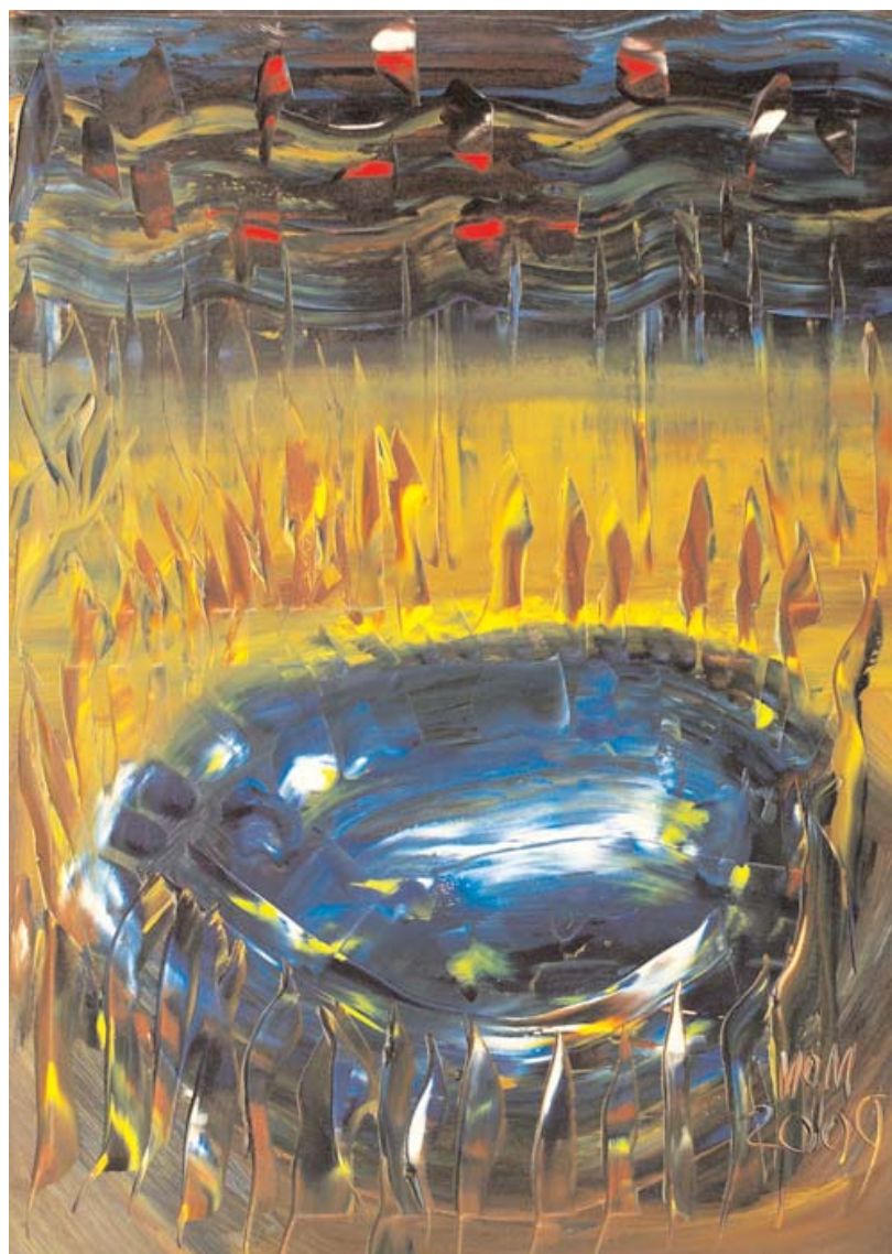
Renuncia de Miguel Oscar Menassa. Óleo sobre lienzo, 100x73 cm.

Una palabra en el espacio, entre las infinitas, sábanas de la muerte.