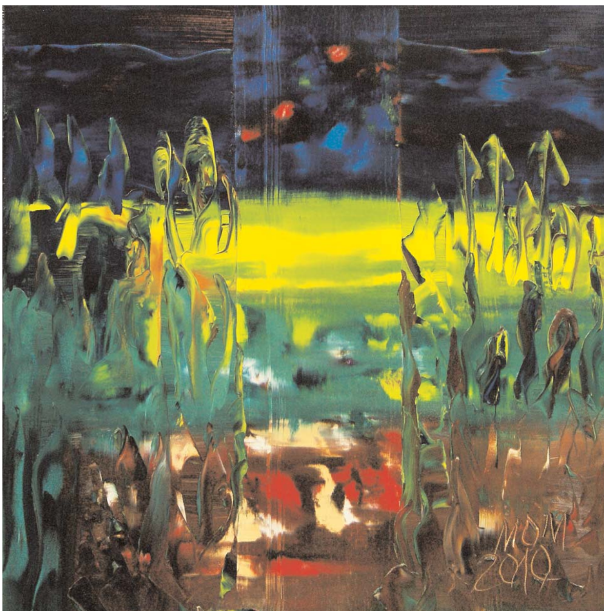
Delirio de amor de Miguel Oscar Menassa. Óleo sobre lienzo, 60x60 cm.

CANDIDATO AL PREMIO NOBEL DE LITERATURA 2010