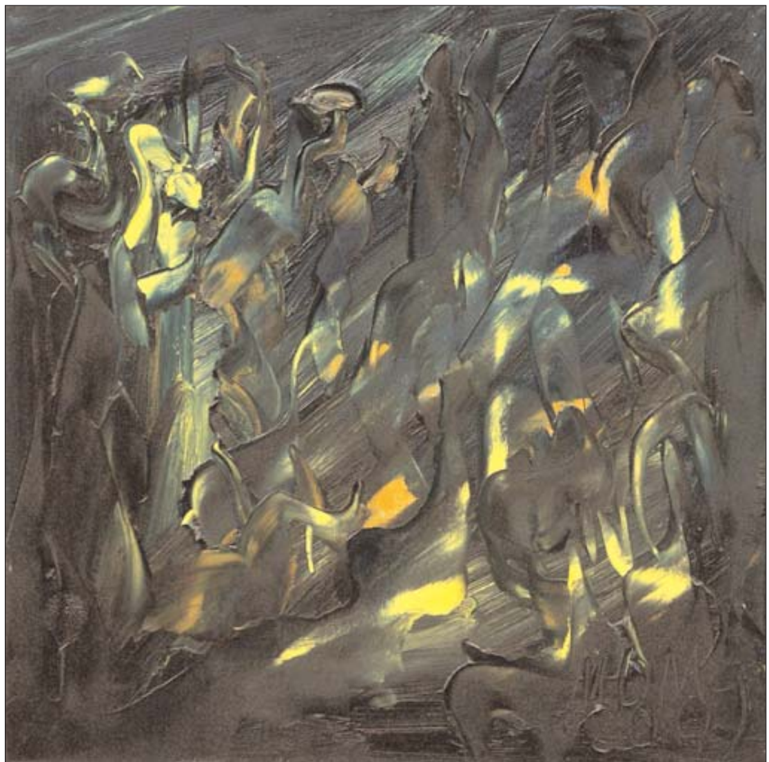
Nocturno del hueco de Miguel Oscar Menassa. Óleo sobre lienzo, 40x40 cm.

Después caprichos y locuras se llevaron el alma. El cuerpo enloquecido fue creciendo voraz y nos comimos, en silencio, todas las palabras.