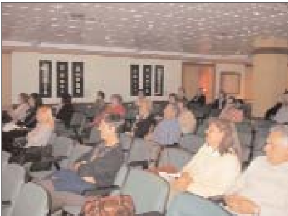
Público asistente al acto.

El amor es libertario, si yo la amo a ella, lo único que ambiciono es su felicidad. No me importa si es conmigo o con Dios, no me importa, me importa que sea feliz, eso es el amor. El amor por lo hijos: me importa que mis hijos crezcan libremente, hermosamente y de manera grandiosa, conmigo o sin mí, ése es el amor. En cambio, en el enamoramiento mis hijos son mis hijos, tienen que tener la educación que yo tengo, tienen que vivir como yo vivo... Insoportable.