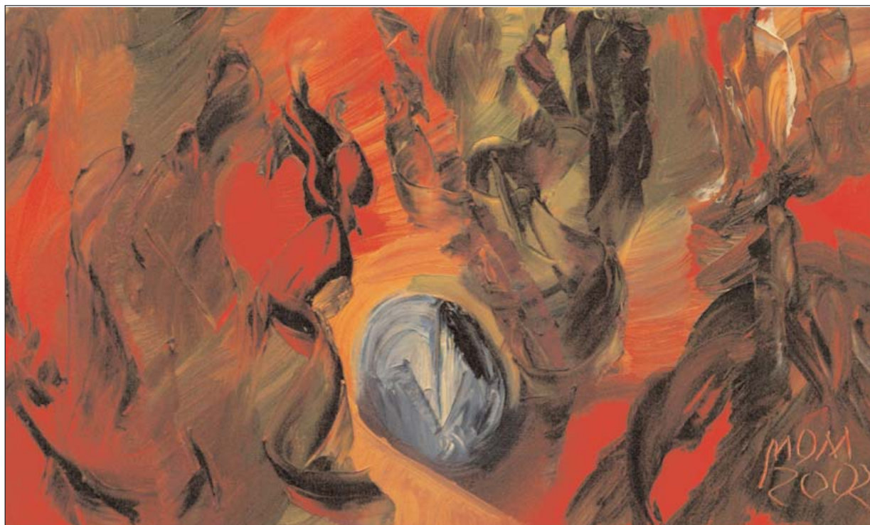
Conjunción astral de Miguel Oscar Menassa. Óleo sobre lienzo, 33x55 cm.

Haré un hoyo en el campo y esperaré a que venga la muerte en dirección a mi garganta con un cuerno, un tintero, un monaguillo y un collar de cencerros castrados en la lengua, para echarme puñados de mi especie.